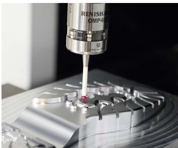
Merilna glava za obdelovalne stroje OMP40-2

Kupci so izdelek Hartrol Plus dobro sprejeli in do danes je bilo prodanih že več kot 1000 enot.