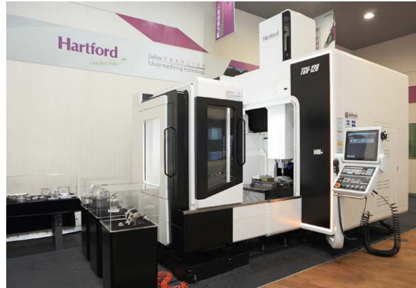
Hartford proizvaja zaokroženo paleto srednjih in velikih triosnih in petosnih CNC-strojov