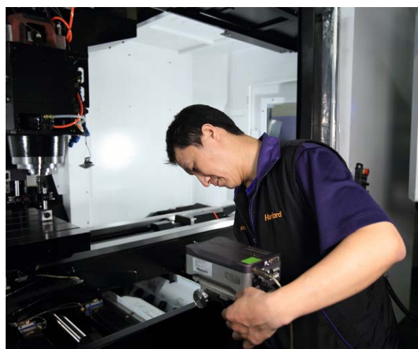
Hartfordov zaposleni umerja stroj z laserskim interferometrom XL-80