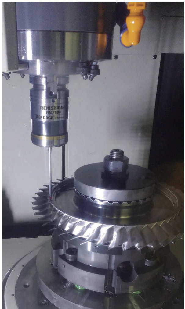
雷尼绍RMP600高精度触发式测头

“在评估了雷尼绍的测头产品系列后，我们决定购买采用无线电信号传输的RMP600机床测头。这款测头具备自动工件找正的全部优点，并且能够测量复杂3D工件的几何特征，比如我们的叶轮。”